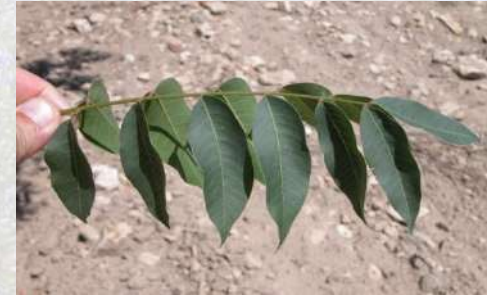
Pistacia terebinthus x P. integerrima