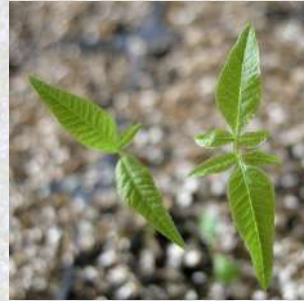
Pistacia terebinthus x P. atlantica